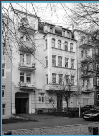
Das ehemalige Judenhaus in der Hallgarter Str. 6.