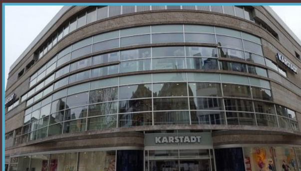
Das ehemalige Judenhaus in der Kirchgasse 43.

Dem Namen nach war dieses Gebäude kein »Judenhaus«. Im Pflaster sind acht Stolpersteine verlegt. Auch auf die letzte Wohnstätte von Erna Loeb und Dr. Alfred Loeb wird glänzend aufmerksam gemacht. Sie wurden am 10. Juni 1942 deportiert.