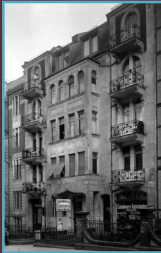
Das ehemalige Judenhaus in der Hallgarter Str. 6-früher. Sammlung M. Sauber. Mit freundlicher Genehmigung.